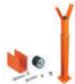
WA11 podpora ramienia stała, regulowana wysokość 250,00 307,50 brutto