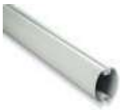
XBA19 ramię aluminiowe, owalne, 45x58x4000 mm 150,00 184,50 brutto