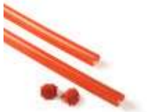
XBA13 listwy ochronne, gumowe, czerwone na ramię XBA 9x1 m 120,00 147,60 brutto