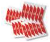
WA10 nalepki ostrzegawcze na ramię szlabanu (24 szt.) 80,00 98,40 brutto