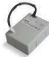
PS124 akumulator 24V 1,2 Ah z wbudowaną kartą ładowania 290,00 356,70 brutto