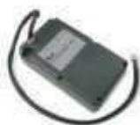
PS224 akumulator 24V 7.2 Ah z wbudowaną kartą ładowania 460,00 565,80 brutto