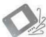
XBA16 płyta montażowa z kotwami 200,00 246,00 brutto