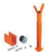
WA11 podpora ramienia stała, regulowana wysokość 250,00 307,50 brutto