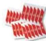
WA10 nalepki ostrzegawcze na ramię szlabanu (24 szt.) 80,00 98,40 brutto