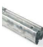
XBA9 łącznik do ramion XBA15/XBA14/XBA5 80,00 98,40 brutto