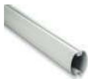
XBA14 ramię aluminiowe, owalne, 69x92x4150 mm 220,00 270,60 brutto