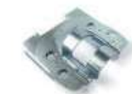
XBA10 uchwyt przegubowy dla ramion 3 lub 4 m 370,00 455,10 brutto